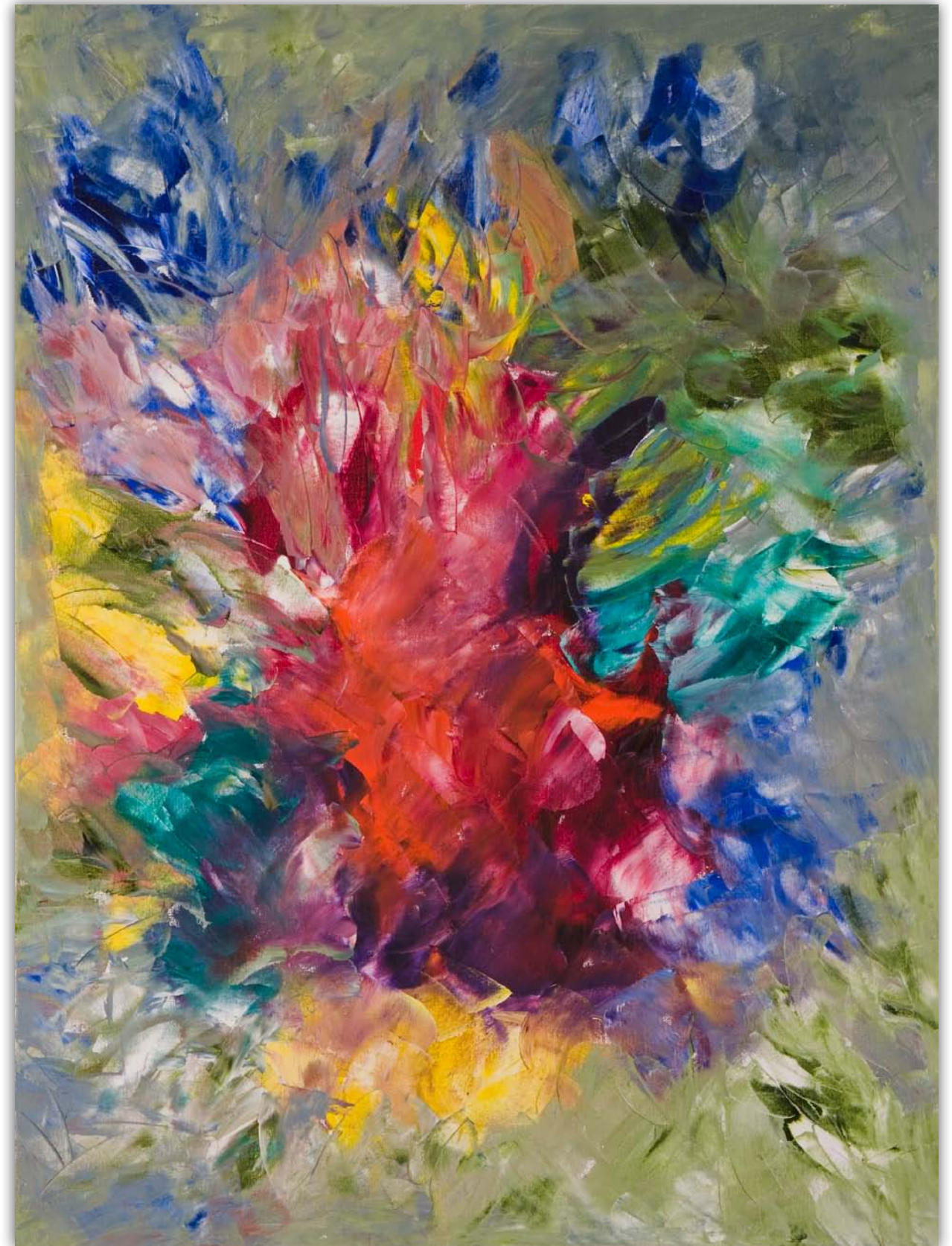
Licht am Weg • Oel auf Leinwand 80 x 60 cm

Was du empfangen hast du hergegeben. Das Licht am Weg bist du! Du bist vereint! Vereint in Gott, in Liebe, Frieden, voller Leben. Lass Freudentränen fließen, hast du heute schon geweint?