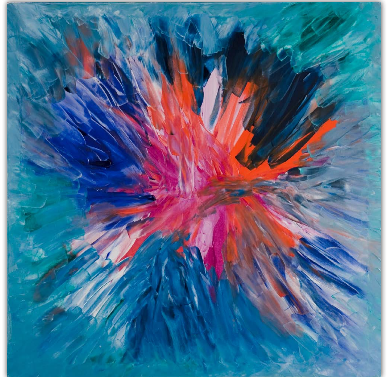
Aufbrechende Seele • Oel auf Leinwand 80 x 80 cm

Bricht die Seele auf? Kraft und Vertrauen